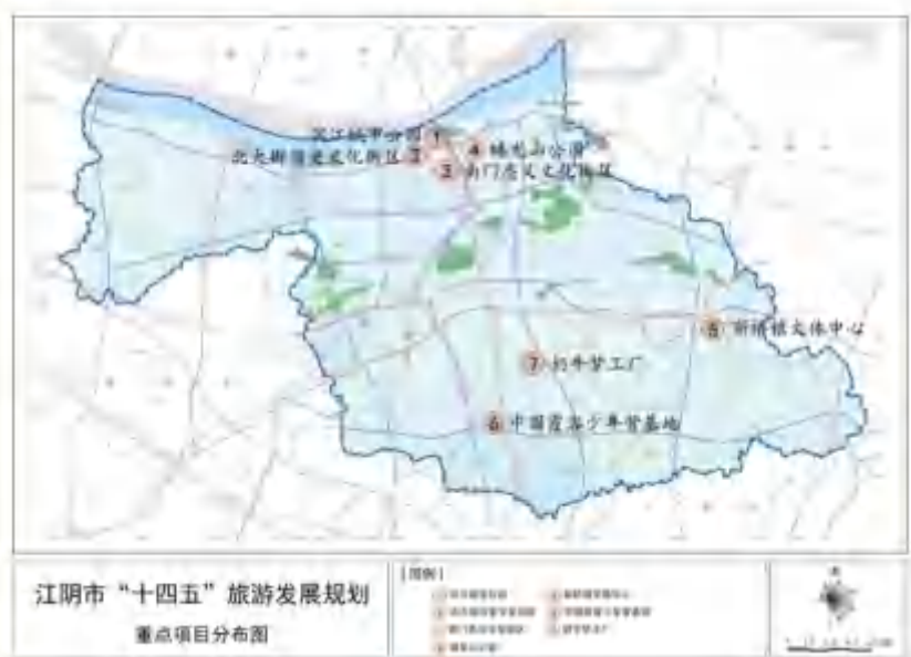
图2 江阴市“十四五”旅游重点项目

发挥江阴制造业优势，发展移动式装配建筑制造、邮轮游艇等旅游设施装备产业，发展高端体育装备、旅游者户外装备生产、智能运动装备等体育旅游装备产业，发展智能可穿戴设备、超高清终端设备、智能硬件、沉浸式体验平台和辅助工具等智慧旅游装备产业。